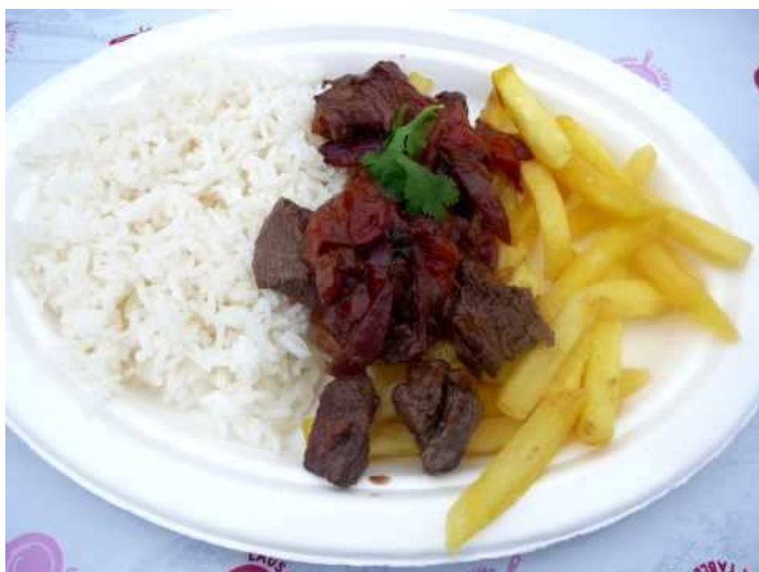
Lomo saltado de Deli Inka

Par rapport au Food Truck Festival, le Miam Festival se caractérise principalement par la présence d'artisans gourmands ainsi que par des événements culinaires organisés sur la place de la Riponne. Malgré une météo catastrophique le vendredi soir, Lausanne à Table annonce une participation supérieure de 15 % par rapport au Food Truck Festival de 2016 avec une estimation à 30'000 participants pour 2017. Ceci n'était pas évident pour moi lors de mes passages vendredi et samedi soir, mais s'expliquerait par des horaires étendus ainsi que par la participation aux événements gourmands.